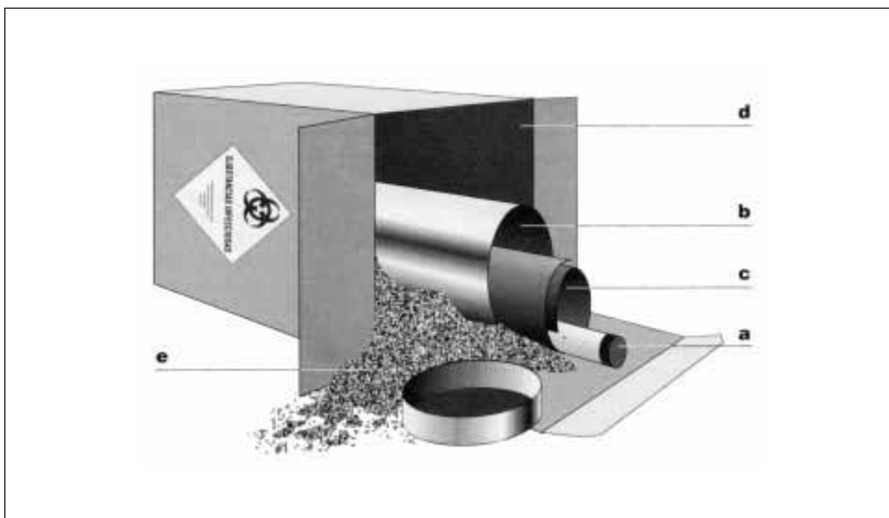
Figura 1 - Embalaje de material biológico peligroso.

En la parte exterior de este recipiente irá adherido un ejemplar del formulario de datos relativo a la muestra, así como cartas y demás material informativo que permitan identificarla o describirla. Los otros dos ejemplares son para el laboratorio receptor que lo recibirá con suficiente antelación por correo aéreo y para el expedidor. Esto permite que el receptor identifique adecuadamente la muestra, esté prevenido sobre su llegada y pueda tomar las disposiciones oportunas para que manipulación y examen se hagan en condiciones de seguridad.